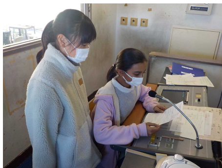
せいけつ検査の呼びかけ