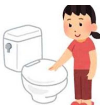
トイレトパーの補充